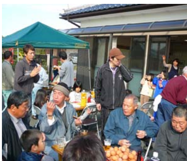
中央の丸いのは昭ちゃん卵

収穫祭では、もちつきや、模擬店のほか抽選会を行いました。10名に図書カードが当たりました。