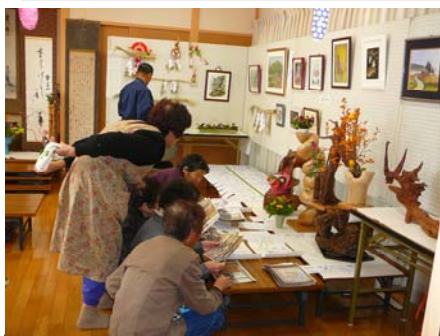
展示作品と地区のみなさん

もちつきのほか、自然薯、やきとりや、やきそば、フライドポテトなどの屋台もあり、賑やかな収穫祭となりました。会館の内部では、押し花や、しめ縄、陶芸の作品などを展示して、みなさんに見ていただきました。