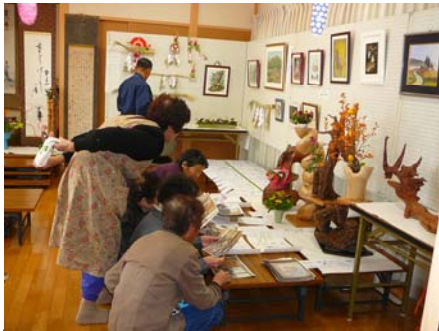
展示作品と地区のみなさん

もちつきのほか、自然薯、やきとりや、やきそば、フライドポテトなどの屋台もあり、賑やかな収穫祭となりました。会館の内部では、押し花や、しめ縄、陶芸の作品などを展示して、みなさんに見ていただきました。