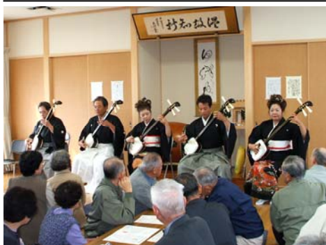
訓峯会のみなさんの演奏