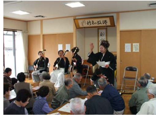
ふれあい敬老会 訓峯会のみなさんの演奏