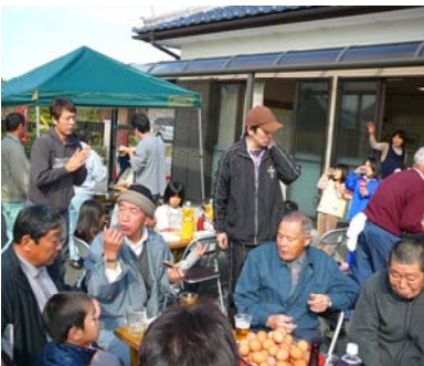
中央の丸いのは昭ちゃん卵

収穫祭では、もちつきや、模擬店のほか抽選会を行いました。10名に図書カードが当たりました。