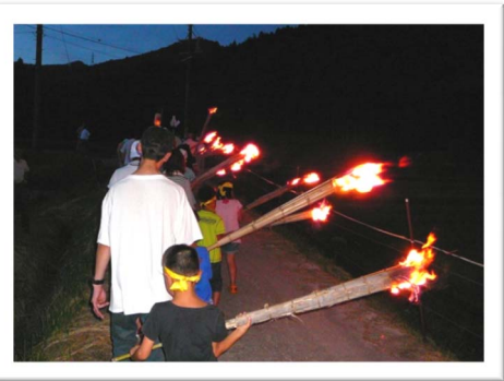
あたりが暗くなってきました