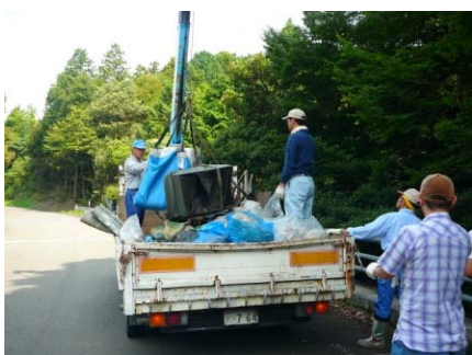
回収作業の様子(小穴谷口)

ありました。自治会として対策を考える必要があると思います。自治会から 不法投棄をなくそう！ みなさまのご協力を！