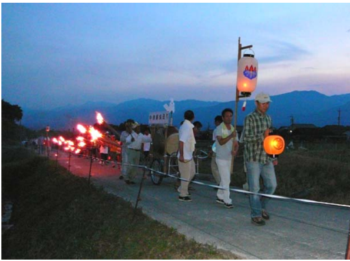
田んぼの中を進む虫送り

中津原では 60年前に行われたのが最後とのことですが、近年虫送りを復活させてはどうか、当時を知っている人も少なくなってきた。こんな声が聞かれるようになり、