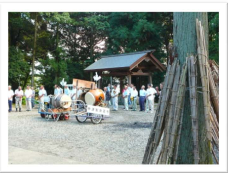
境内でお祓いを受けます