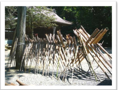
年配の方に作ってもらったたいまつ