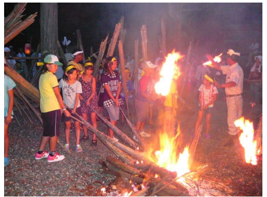
いよいよ松明に火を着けます

らったので、多くの方から “すごいことしとるなあ！” と連絡をもらったり、当日は、「四日市から新聞を見て来ました。」という御夫婦もみえたようです。たくさんの方に参加してもらいました。