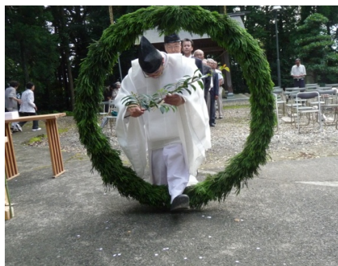
茅の輪くぐりの様子

六月三十日(水) 中原神社で半年間の罪穢れを祓い、夏を健康で過ごせるよう、夏越の大祓が行われました。 今年は、大きな茅の輪が掛けられ、官司につづいて、両中津原自治会長、宮元、そして、参詣のみなさん全員が茅の輪をくぐりました。まず、茅の輪の正面からくぐって左回り、次は、くぐって右回り、