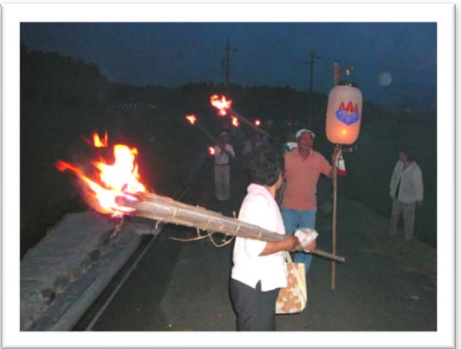
暑さの中少し疲れてきましたか!?