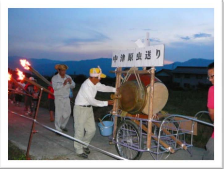
鉦・笛・太鼓が響きます